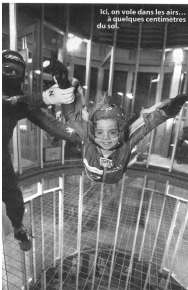
Femme Actuelle, n° 1112

Pour chaque item, cochez ensuite la case correspondant à votre choix sur la feuille de réponses.