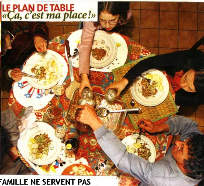
LE PLAN DE TABLE «Ça, c'est ma place!»